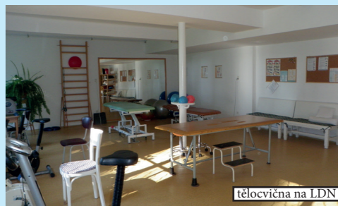
telocvična na LDN